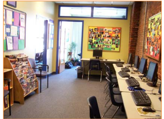
Sala de ordenadores

La experimentada plantilla de la Escuela ofrece una atención personalizada a cada estudiante, siendo muy conscientes de las posibilidades educativas existentes tanto en las aulas, como fuera de las mismas. Los profesores aconsejan a los alumnos en el aprendizaje y participan en las actividades deportivas y recreativas, lo que ayuda a que el ambiente sea distendido y a crear lazos de amistad entre todos ellos.