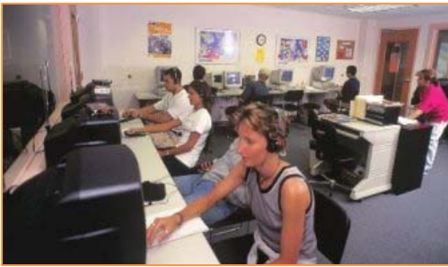
Sala de ordenadores

A lo largo sus años acogiendo alumnos de diferentes nacionalidades, La escuela ha desarrollado una infraestructura que le permite ofrecer una gran calidad, tanto en la enseñanza de la lengua inglesa, como en el alojamiento de los alumnos y en la organización de actividades recreativas y culturales.