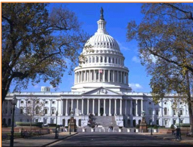
El Capitolio (Washington D.C.)

La Escuela también organiza regularmente excursiones * de medio día o de día completo a: