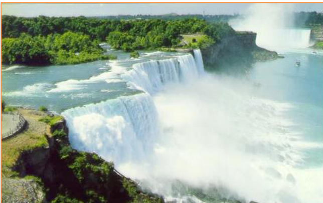
Cataratas del Niágara

La Escuela también organiza regularmente excursiones * de medio día o de día completo a: